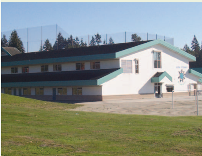
Figure 6 • École Roy Stibbs, Colombie-Britannique

Un exemple de la réutilisation de l'acier est celui de l'école élémentaire Roy Stibbs, à Burnaby (C.-B.), au Canada. Une nouvelle aile a été construite à partir d'éléments d'acier provenant de l'ossature d'acier d'un établissement scolaire abandonné du nord de la Colombie-Britannique. Cet établissement a été démonté et 75 % de son ossature a été remontée à Burnaby pour être utilisée dans la nouvelle aile à partir des plans d'atelier originaux. Des essais indépendants des matériaux ont permis de s'assurer que tout dommage occasionné par le démantèlement ou le transport était bien analysé et réparé. La structure a été renforcée par l'ajout d'armatures en chevron. La réutilisation de matériaux a également permis de gagner plusieurs mois sur le calendrier de projet.