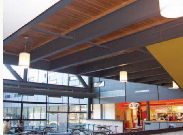
Figure 4 • Le centre des étudiants du Campus de Scarborough de l'Université de Toronto intègre de l'acier récupéré.

L'acier est un matériau précieux qui est généralement recyclé ou réutilisé lorsqu'il constitue un déchet de construction ou de démolition. Tout l'acier de démolition peut donc être envoyé directement au recyclage ou à la réutilisation, ce qui est très avantageux dans le cadre de ce crédit. De plus, l'utilisation d'éléments d'acier sur place génère très peu de déchets, car les éléments sont habituellement fabriqués en usine suivant de strictes tolérances et livrés sur le site pour assemblage. Toute chute d'acier générée est précieuse et peut être recyclée directement. Par conséquent, le recours à des ossatures d'acier et à d'autres éléments d'acier devrait contribuer grandement à réduire la production de déchets sur un site.