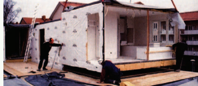
Figure 2 • La préfabrication peut réduire l'impact des travaux sur le site

Le crédit relatif à la Remise en valeur de sites contaminés (Aménagement durable d'un site, crédit 3, un point) porte sur l'aménagement de sites industriels ou commerciaux désaffectés présentant une contamination réelle ou perçue. Tout comme pour les sites urbains, l'aménagement des sites contaminés (friche industrielle) peut tirer profit de l'utilisation de structures légères, qui exigent moins de travaux préliminaires, et de la préfabrication