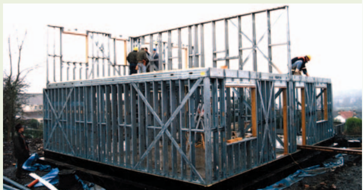
Figure 3 • Construction typique à ossature d'acier léger

La maison a également une certification EnviroHome, accordée à un nombre restreint de nouveaux projets résidentiels dans tout le Canada qui dépassent les exigences R-2000 pour intégrer des caractéristiques supplémentaires de qualité de l'air et environnementales.