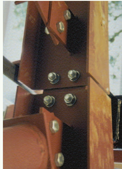
Figure 5 • Bolted connections allow disassembly allowing easier reuse

La majorité de l'acier recyclé utilisé au Canada provient de sources locales à proximité de l'usine sidérurgique.