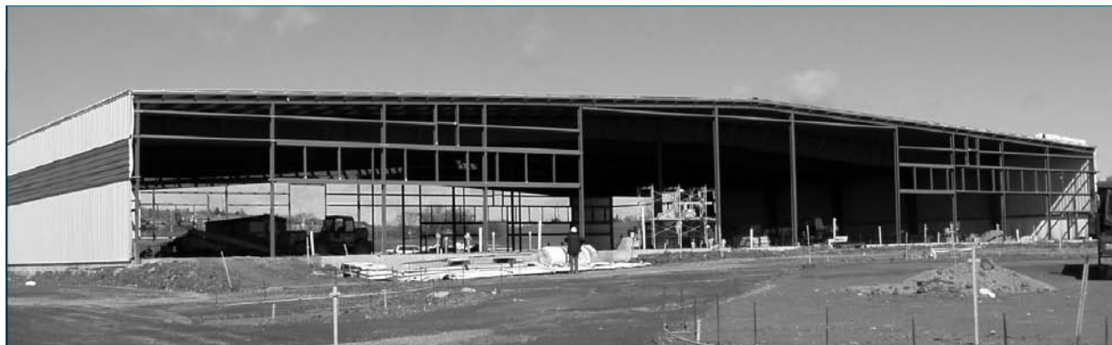
Figure 2 : Construction d'un bâtiment à toiture inclinée typique

L'eau de pluie, incluant l'eau de la toiture, peuvent être retenues sur les surfaces pavées. La vidange de l'eau des bassins-versants est contrôlée par des ouvrages de vidange qui restreignent le débit.