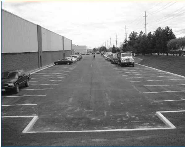
Figure 3 : Les parcs de stationnement sont parfois idéaux pour contrôler les eaux pluviales