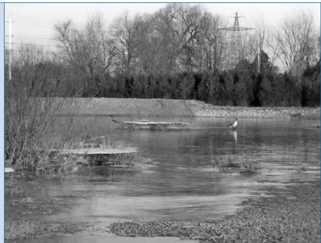
Figure 4 : Étang de gestion des eaux pluviales