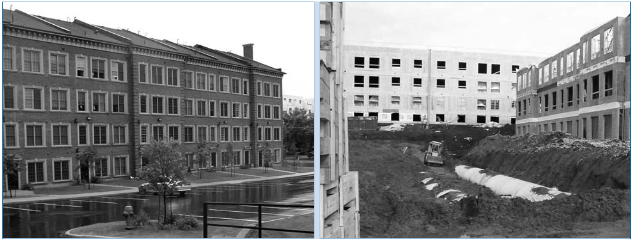
Figure 5 : Les systèmes de rétention à buses en tôle ondulée sont discrets et dimensionnés conformément aux exigences du site

concepteurs d'adopter presque tous les plans concevables. Les trous d'homme, les puisards, les coudes et les raccords en T sont fabriqués en usine, ce qui simplifie l'installation sur le terrain.